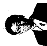
■プロセグーター 霜山元氏 株式会社ユー・マン・ハブ プロセグーター